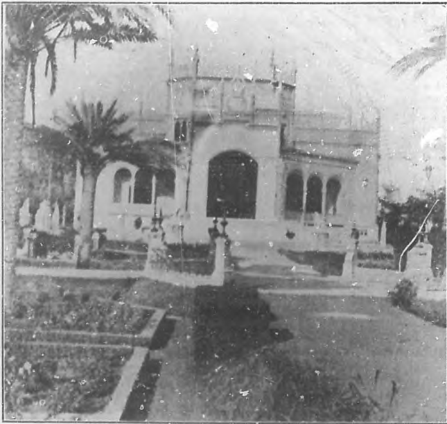
VISTAS DE ESPAÑA.— Un interesante y poético detalle del hermoso parque María Luisa, de Sevilla.

(El escritor se detiene, alza la vista y termina su trabajo.) ¿No será un sarcasmo horrendo que la conciencia pública permanezca indiferente, y que los periódicos apenas publiquen un sencillo suelto informativo, cuando la nación sufra la pérdida de un hijo benemérito, un sabio, un hombre de ciencia, un gran artista, una gloria de las letras?.