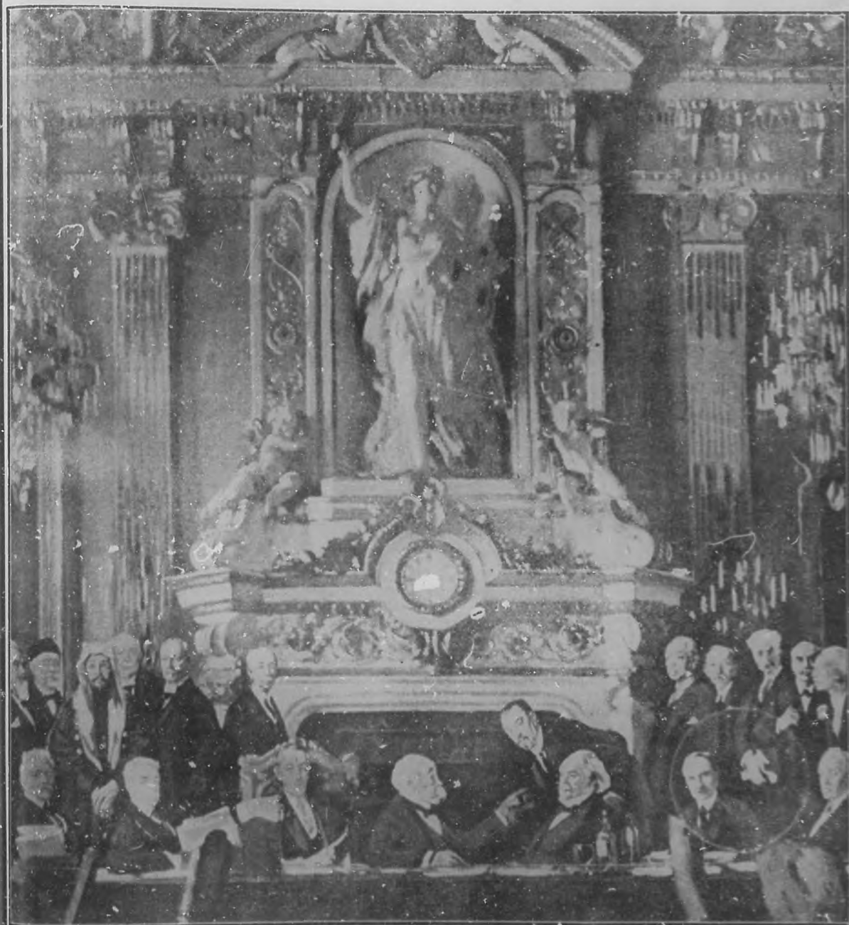
LA CONFERENCIA DE LA PAZ

Magistral cuadro del notable pintor inglés Will'am Orpen, que ha sido adquirido por la "Royal Academy", de Londres. En el cuadro aparecen retratados Clemenceau, Wilson, Lloyd George, Orlando y otros insignes personajes.