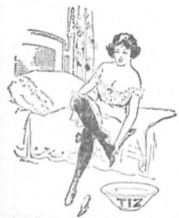
¡Ay!—no puedo esparar para bañar mis pobres pies en Tiz.

Pídalo al Apartado 1915 o por el teléfono A-8733.—Habana.