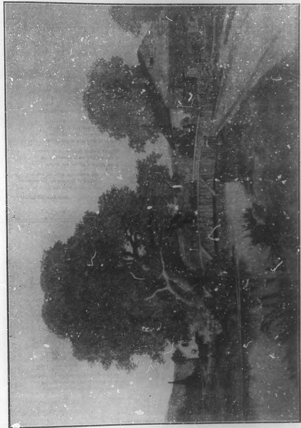
(Orchido tricolor de BOHEMIA.)