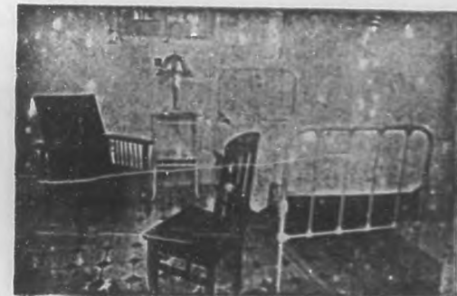
Una de las higienicas habitaciones para operados en la "Clinica Ledon-Uribe".

Situada en la esquina de San Rafael y Masón, próxima a la Universidad Nacional, alzáse a una altura de veinte y seis metros sobre el nivel de mar.